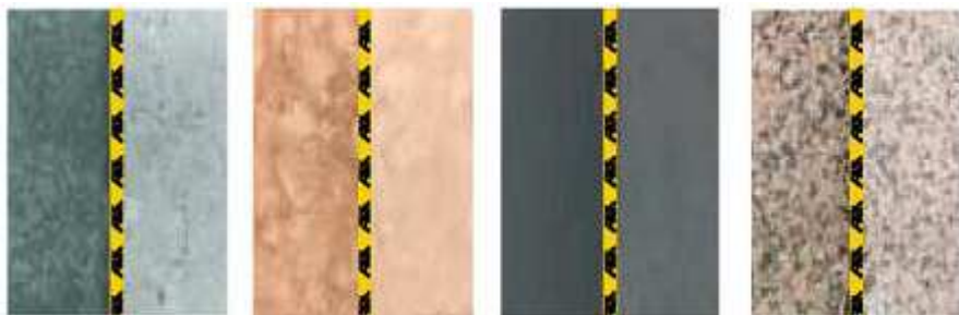
vlevo – ošetřený povrch s FILA STONE PLUS, vpravo – neošetřený povrch